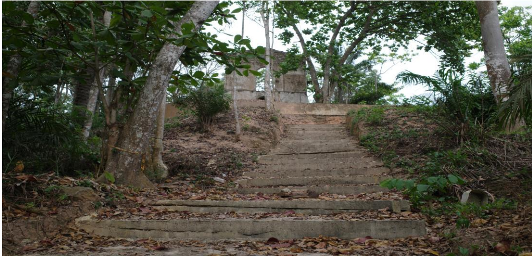
Photo n°2 : L'ancienne bâtisse ayant servi de prison pour le prophète William Wadé Harris (au fond de l'image)